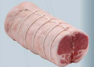
Rôti de longe double désossé