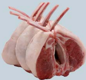
Rôti carré français double