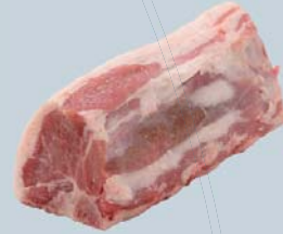
Rôti de longe avec os