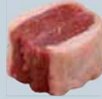
Longe papillon désossée