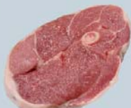
Tranche de gigot centre