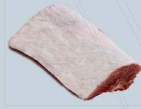
Rôti carré (8 côtes)