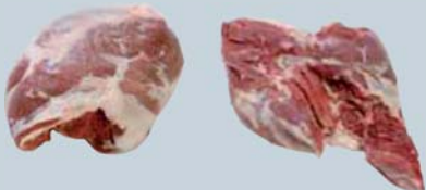
Rôtis de gigot désossé