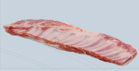
Coté de flanc