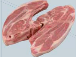
Tranche de palette duo