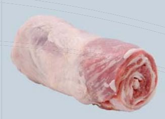
Flanc désossé roulé