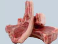
Côtelette à manchette