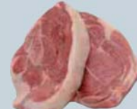
Tranches de surlonge avec os et filet duo