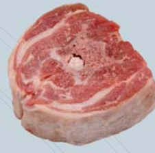
Tranche de collier