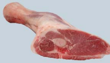
Jarret avant côté cubitus