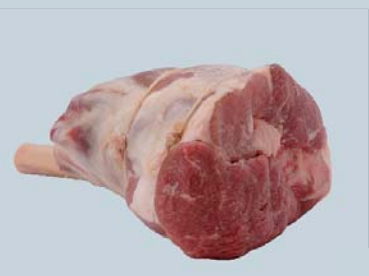
Jarret français portion centre