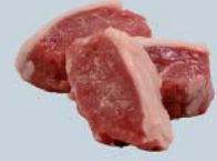
Longe désossée noisettes