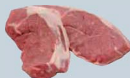
Tranches de surlonge désossée