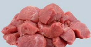
Agneau à mijoter