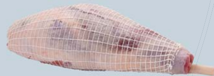
Gigot long français