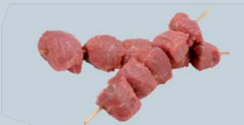
Cubes à brochette