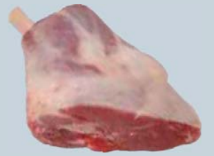
Jarret avant français