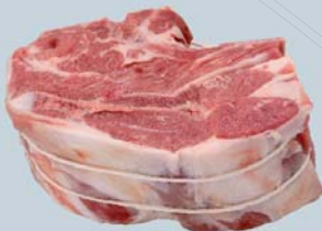
Rôti d'épaule avec os