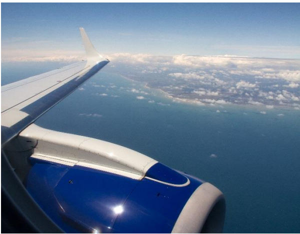
Southern England (5842788384)