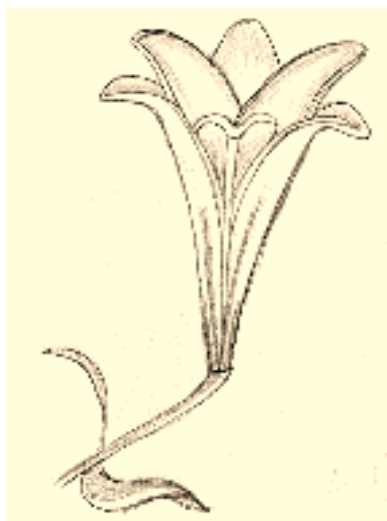
Lys blanc , par Julie Larivière et Éric Lessard, sous licence Creative Commons Attribution – Utilisation commerciale interdite – Partage à l'identique Canada 2.5