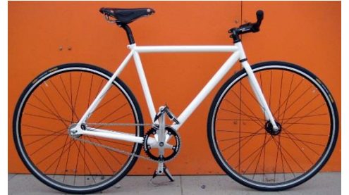
My new bike [Cropped]