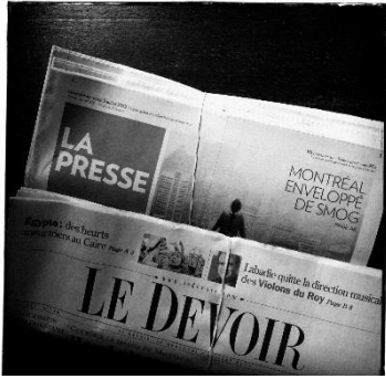
« Êtes-vous plus La Presse ou Le Devoir? »