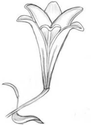
Lys blanc , par Julie Larivière et Éric Lessard, sous licence Creative Commons Attribution - Utilisation commerciale interdite - Partage à l'identique Canada 2.5